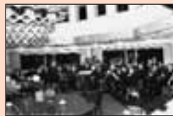
5 Concert van Hallelujah in Avondrust