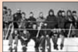
9 Voorlichting en schoolkeuze