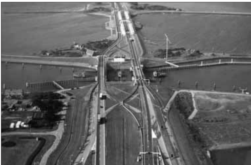
* Luchtfoto bruggencomplex Kornwerderzand op de Friese Kop van Afsluitdijk met bovenaan de bestaande Spuisluizen en links een gedeelte van het Kazemattenmuseum.