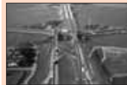
11 Kazemattenmuseum werft vrijwilligers op informatiedag