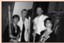
5 Koepelconcert Witmarsum