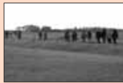
4 Pluvius was de kuieraars goed gezind