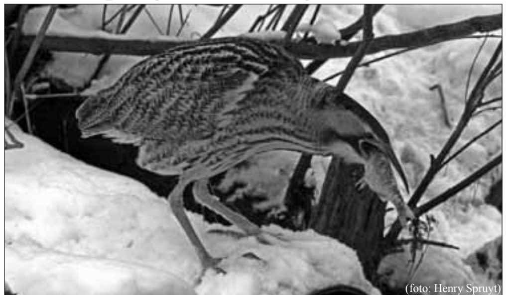
* Roerdomp op Makkumer Noardwaard

Makkum - Zoals afgelopen week al in deze krant te lezen was is Vogelwacht op diverse locaties in Makkum en omgeving aan het bijvoeren. Op de Makkumer Noardwaard wordt ook gevoerd en wel met vis, specifiek voor de kwetsbare Roerdomp. Deze reigerachtige komt