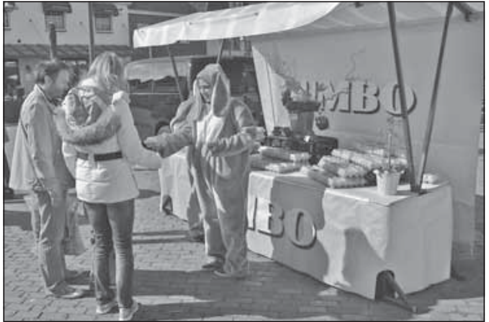
Er was veel belangstelling bij het kraampje van de Peaskewilledei.