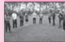
9 Kaatstrainers in opleiding bij Kaatsvereniging Makkum