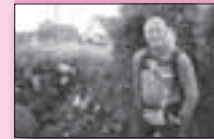
6 Christ Mol loopt voor Stichting De Hoop