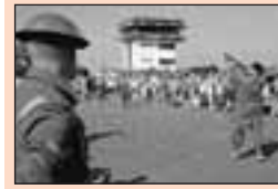
9 Museum weekend Kazematten