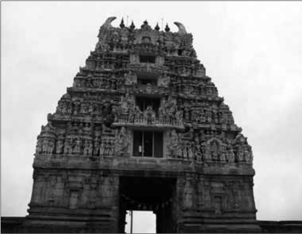
* De Channekeshava tempel staat in Belur en is in 1116 gebouwd

Na een onrustig nachtje gingen we de volgende ochtend weer verder we reden omringd door rubberplantages, rijstvelden, tabaksvelden, zijde plantages en prachtige lelies en lotus bloemenvelden adembenemend mooi. We stopten onderweg voor een ontbijtje dit bestaat in India uit dosa,s dit zijn een soort dun gebakken pannenkoeken met diverse sausjes erbij wij Nederlanders vragen er dan natuurlijk ook suiker bij wat ze heel vreemd vinden. De koffie die we geregeld bestelden was ook meestal een probleem in India drinken ze mier zoete koffie met veel suiker en melk alles wordt in een kan gezet dus zwarte koffie kennen ze niet. We zien onderweg in een rivier een soort zandoverslag bedrijf er rijden wagens met ossen ervoor de rivier in, met manden trekken ze zo zand uit de rivier en dit wordt dan aan wal gebracht daar staan weer mannen klaar die het weer in vrachtauto,s scheppen een zeer arbeid intensief werkje. De politie doet nog pogingen om ons tot stoppen te dwingen ze blazen als gekken op hun fluitje we kijken wijselijk de andere kant op en rijden door. Na 150 km deze dag op de scooter te hebben gezeten komen we 's avonds aan in Chikamagur aan hier vinden we voor het eerst een redelijk goed hotel, we eten in de gezellige stad het diner bestaat hier meestal uit gebakken rijst of noedels met kip of vis zeer smakelijk al moet je wel vragen om niet te gekruid eten want anders sta je in brand.