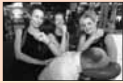
4 Bedrijven contactdagen 2007