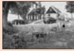
6 Makkum in vroegere tijden.....