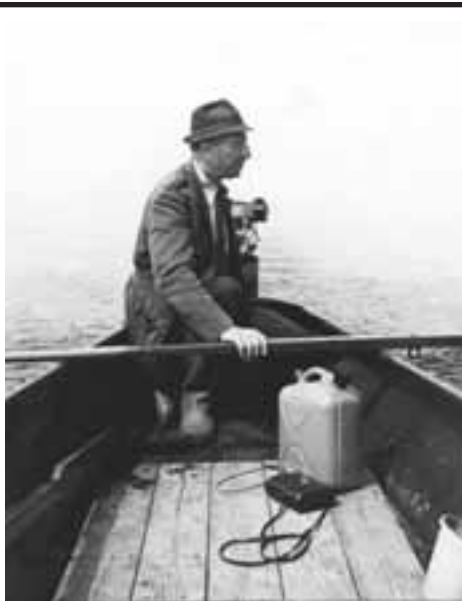
Hertlik tank foar alle oantinken en meilibben nei it ferstjerren fan ús heit en pake