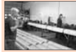
9 De Boer RVS Makkum Een betrouwbaar adres voor de garnalenbewerking, design en maatwerk