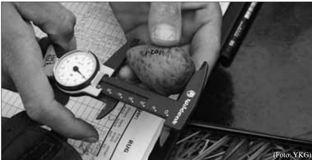
* Het opmeten en vergelijken van Grutto eieren behoort tot één van de bezigheden van de onderzoekers.

Met stokken geven de onderzoekers en nazorgers aan waar de nesten zich bevinden, zodat boeren die bijvoorbeeld willen maaien, weten waar de broedende weidevogels zich ophouden. Dergelijke maatregelen zorgen ervoor dat landbouwers met minimale inspanning nesten kunnen sparen. Enkele boeren zouden reeds het goede voorbeeld geven, maar toch hopen de biologen op nog meer medewerking. Uit 'gemakzucht', 'haast' of te weinig communicatie tussen boeren en vogelbeschermers gaan volgens hen nog te veel broedsels verloren. Tot half juni verblijven de tijdelijke bewoners van de oude kerk in Gaast. Rond deze datum breken de laatste kuikens door hun eierschaal en is het veldonderzoek weer gedaan.