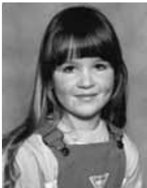
Deze 'verfriesde' meid wordt maandag 30.....

Met 50 nog steeds strak in het pak, de 10 km rent hij nog met gemak. 50 jaar zou je hem nog niet geven, dit heeft hij 5 mei mogen beleven!