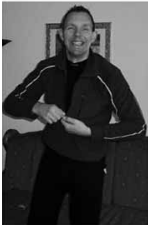
Groeten van familie & vrienden

Dus komt allen naar de pomp en geef hem de hand. we zetten deze boodschap niet voor niets in de krant!