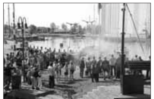
Afvuren kannonen op de haven van Makkum.