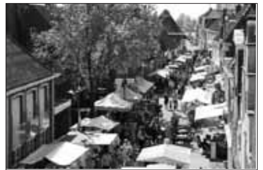
Jaarmarkt in het centrum van Makkum