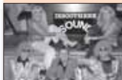
7 Makkum goes Back to THE EIGHTIES