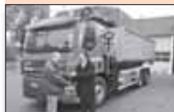
4 Laatste aanschaf nieuwe vrachtauto in de gemeente Wûnseradiel