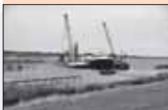
5 Baggeren Makkumerdiep kost 2 miljoen euro