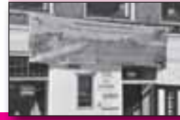
Fûgelwacht Makkum 50 jier!