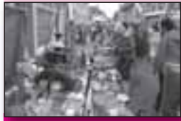
Ook deze zomer gezelligheids markten